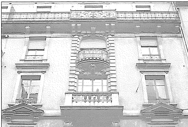
Rue des Vollandes 7