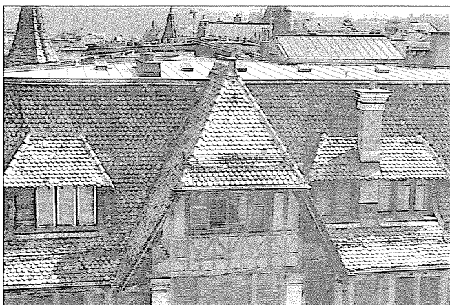
Toitures, côté rue de l'Athénée