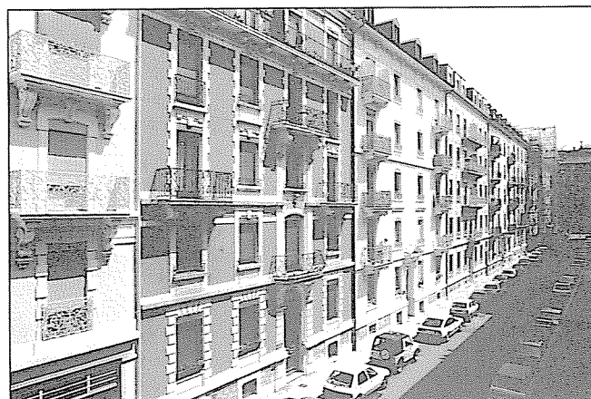
Rue Gérard-Muzy côté impair