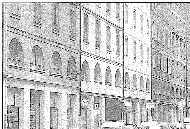
Rue Sismondi 3 à 11

Guide SHAS, p. 203 Guide SAP, p. 203 Archiguide, bus 4