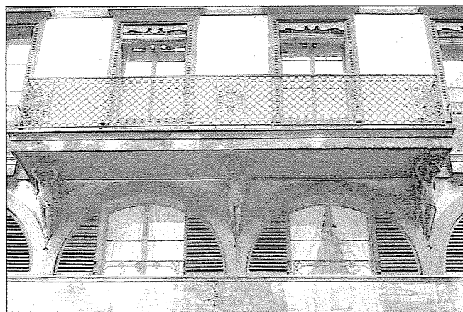
Rue des Pâquis 5