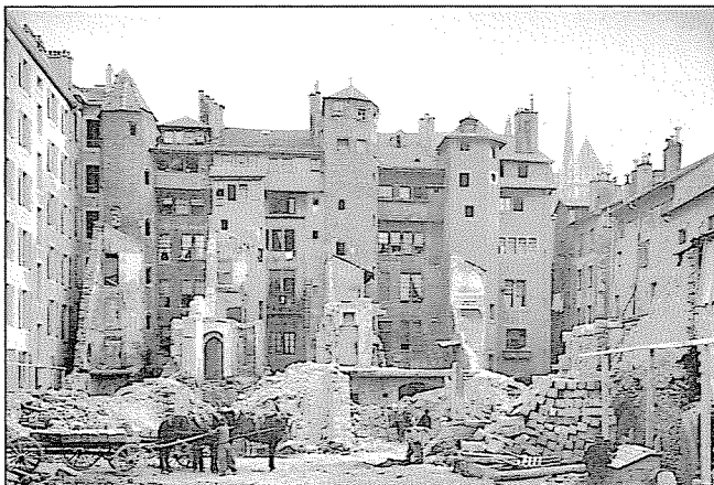
Assainissement urbain vers 1900. A gauche, la rue de la Tour-Maitresse côté cour