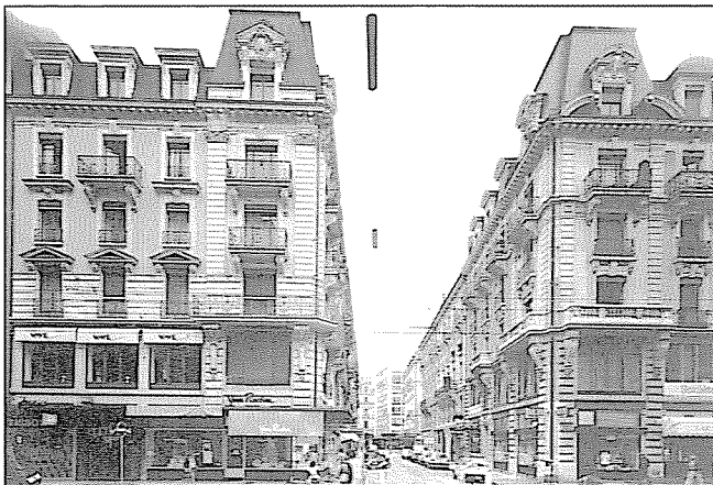
Rue de la Tour-Maitresse depuis la rue de Rive