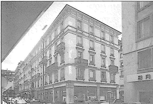
Rue du Prince, au premier plan le no 4