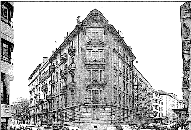
Rue Philippe-Plantamour 45