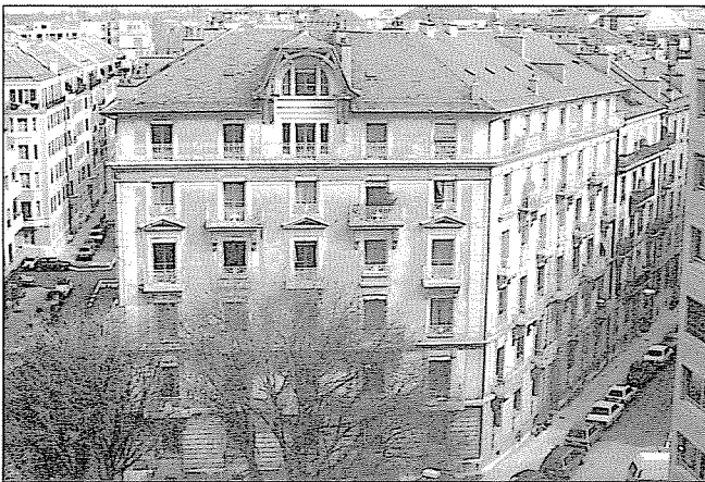
Rue Jean-Jaquet 2, rue Philippe-Plantamour 41

INSA, p. 373 Guide SHAS, p. 204 Guide SAP, p. 206 RDB, nos 1, 2 et 3, 1986 et 1990