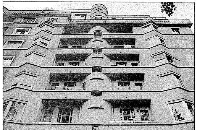
Avenue William-Favre 22

L'architecture de l'immeuble Montchoisy nos 66 à 72 est caractéristique des recherches modernistes des années 1920-1930, ainsi le traitement des angles rendu possible par les dalles en porte-à-faux: balcons ou vitrage sur les deux côtés. Le choix du crépi gris et granuleux s'inspire des courants expressionnistes germaniques.