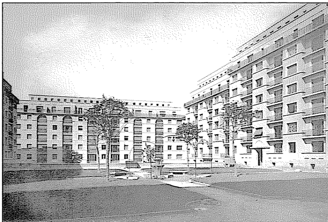
Vue du premier square, septembre 1929