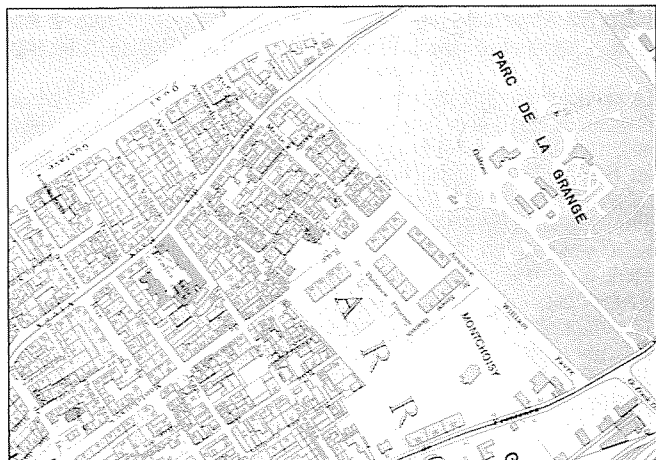
Plan de Genève révisé par Oscar Messerly, 1937. Extrait reproduit à l'échelle 1:10000 (doc. AEG)