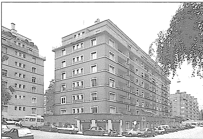
À gauche, l'avenue William-Favre; à droite, la rue de Montchoisy